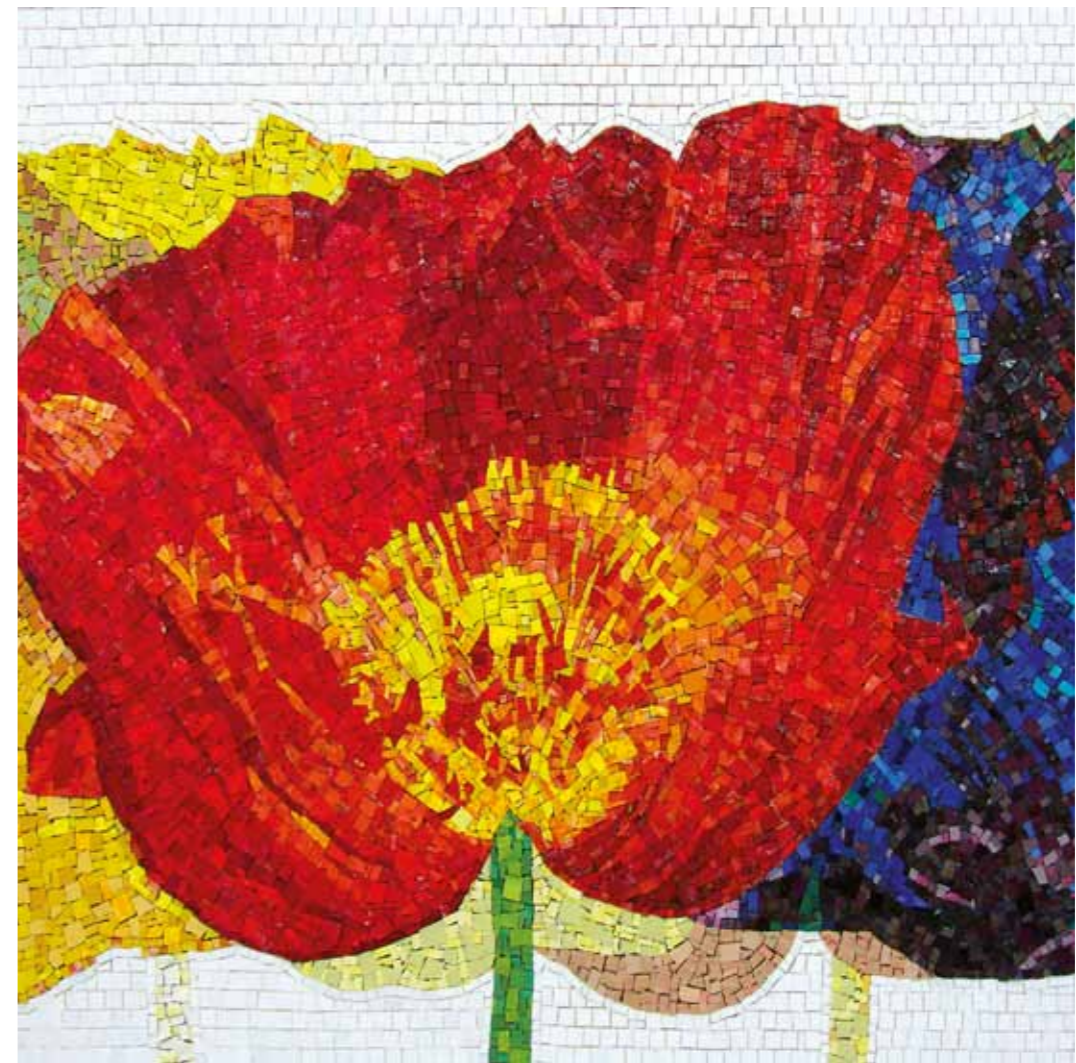
Poppies 200 x 200 cm