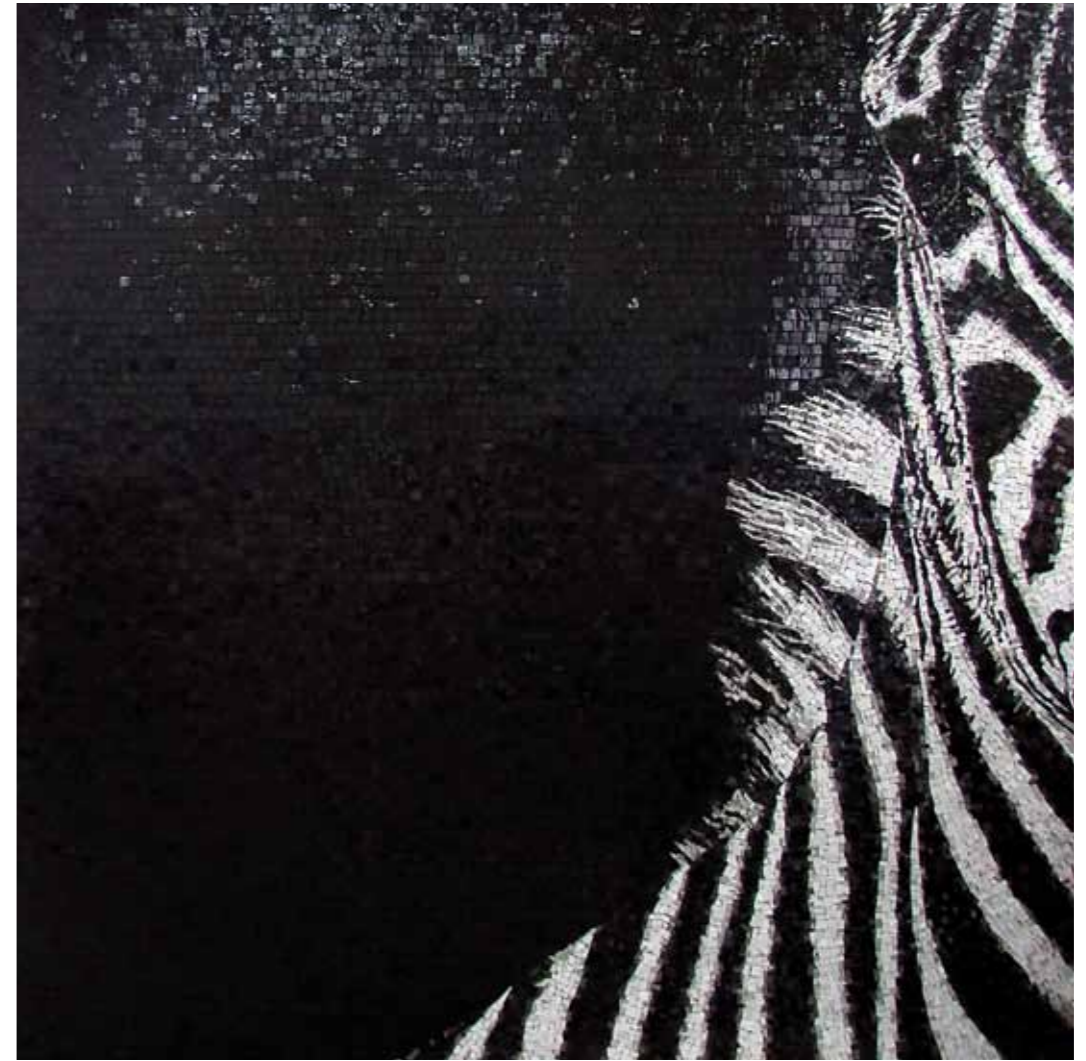
Zebra 200 x 200 cm