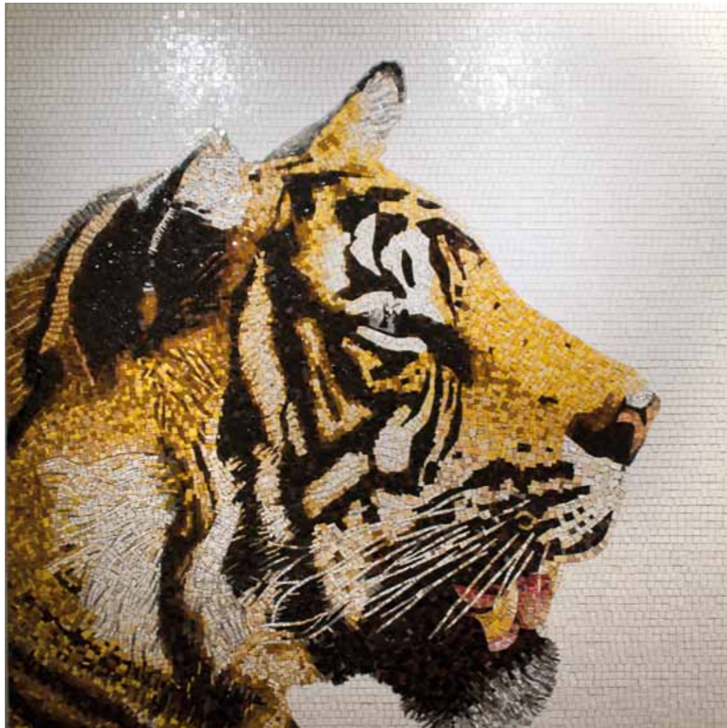
Tiger 200 x 200 cm