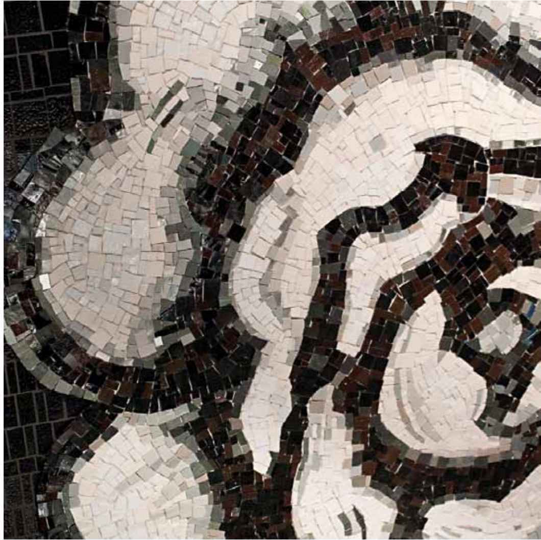
Black rose 150 x 150 cm