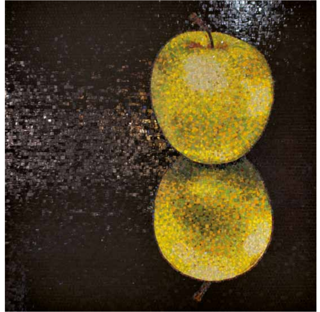
Apple 200 x 200 cm