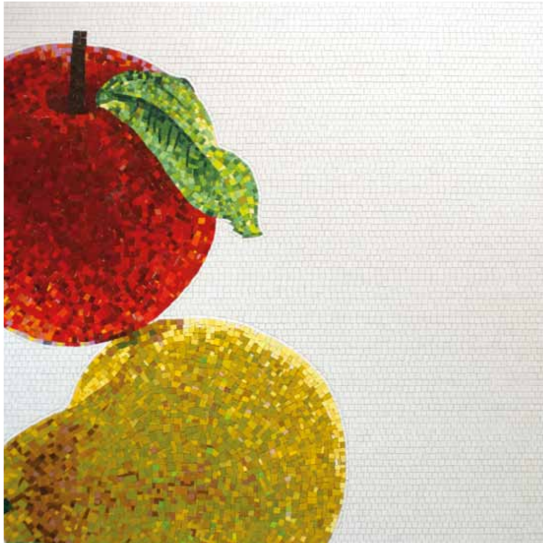
Pear and apple (red and yellow) 200 x 200 cm