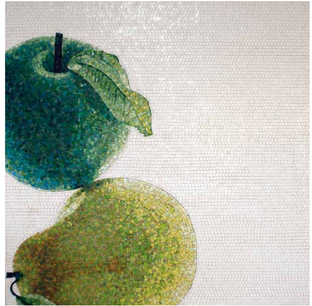
Pear and apple (green) 200 x 200 cm